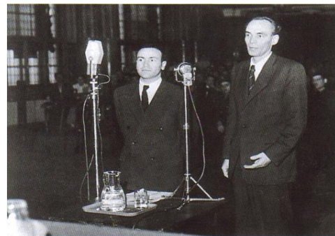
Rajk László a bíróság előtt