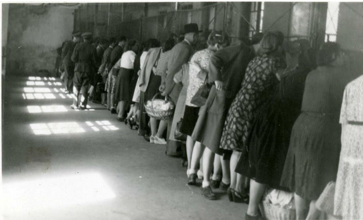
Buda-Dél internálótábor - az internáltak hozzátartozói beszélőn, 1947

Internálótáborok – Kérdés a tanulókhöz: Hol készült az alábbi kép? (A kép a beszélőt ábrázolja.) (5 perc)