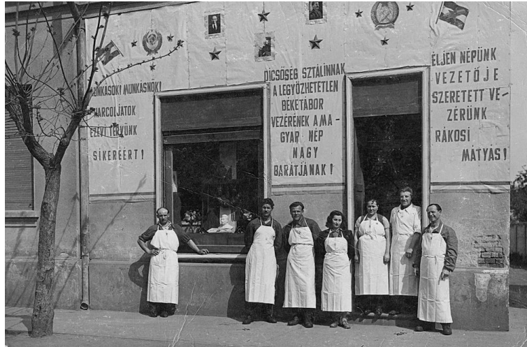
Dombóvár, Hunyadi tér 39., a volt Heckmann-hentesüzlet 1952. május 1-i dekorációja.