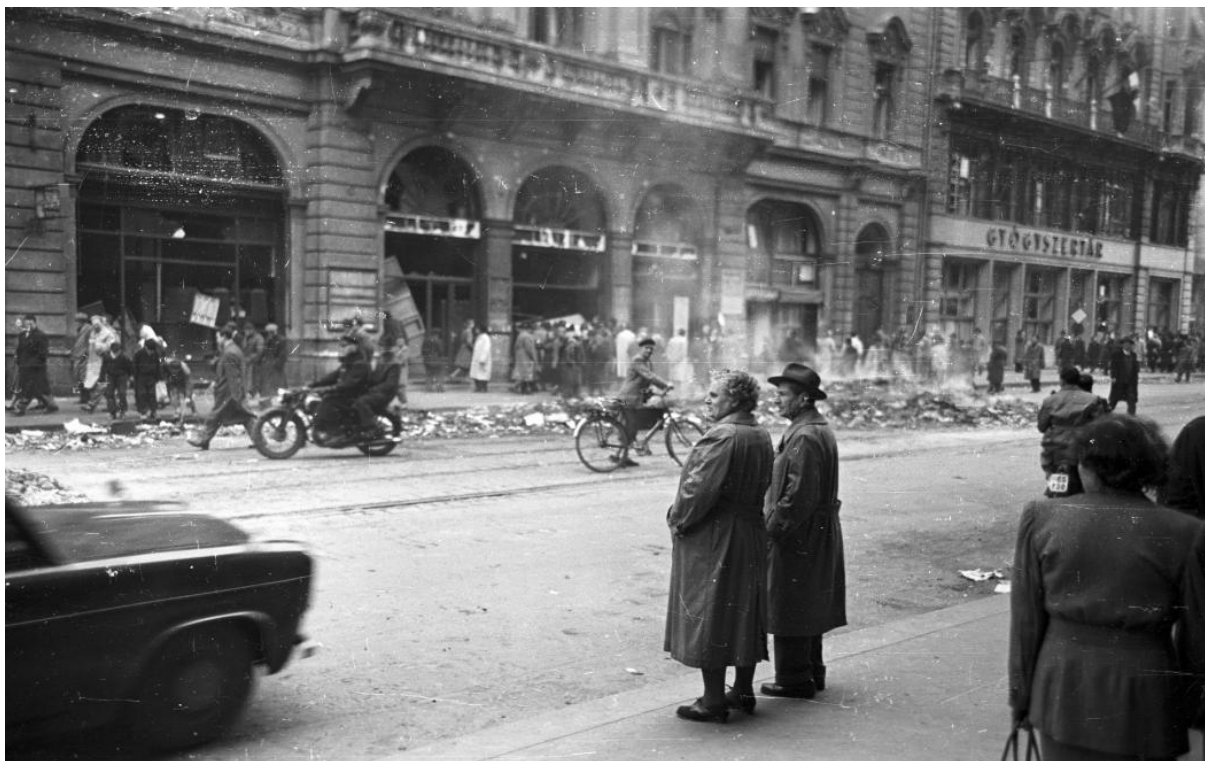
Kossuth Lajos utca 20. Szovjet Kultúra Háza.

©Jelen szakmai anyag az „1956 – a magyar forradalom a legújabb történelmi kutatások tükrében” című akkreditált pedagógus-továbbképzés (alapítási engedély száma: 27282/1/2016) keretében jött létre, amelyet a Prekog Alfa Szolgáltató és Tanácsadó Kft. a Közép- és Kelet-európai Történelem és Társadalom Kutatásáért Közalapítvány megbízásából szervezett. Az anyag minden üzleti célú felhasználása csak a nevezett szervezetek hozzájárulásával lehetséges.