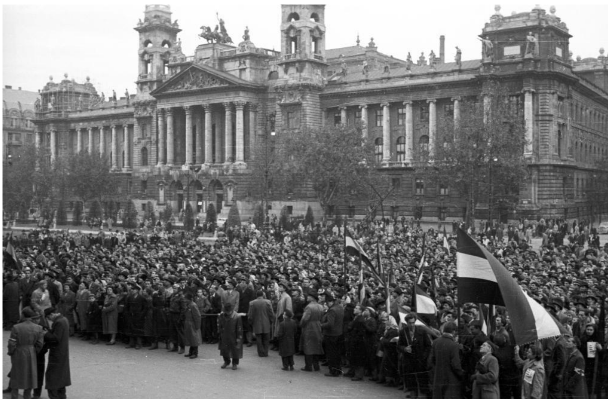
Kossuth Lajos tér, a Munkásmozgalmi Intézet (egykor Kúria, ma Néprajzi Múzeum) épülete.

©Jelen szakmai anyag az „1956 – a magyar forradalom a legújabb történelmi kutatások tükrében” című akkreditált pedagógus-továbbképzés (alapítási engedély száma: 27282/1/2016) keretében jött létre, amelyet a Prekog Alfa Szolgáltató és Tanácsadó Kft. a Közép- és Kelet-európai Történelem és Társadalom Kutatásáért Közalapítvány megbízásából szervezett. Az anyag minden üzleti célú felhasználása csak a nevezett szervezetek hozzájárulásával lehetséges.