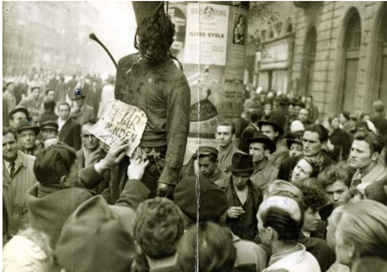
Meglincselt ÁVH-s százados a Lenin körút - Aradi utca sarkán. (1956. október 31-én)

Rendezzenek ún. akadémikus vitát a tanulók az 1956-os népítéletekről , melyekről az interjúalany is beszél! Használhatják a mellékelt forrásokat is, de ha mélyebben szeretnék a témát érinteni, illetve annak erkölcsi vonatkozását, adhatjuk előzetes feladatnak, hogy nézzenek utána a népítéletek mértékének. (Érdeemes hozzá megnézni a Dömötör Zoltánnal illetve a Fogarasi Judittal készült interjút is!)