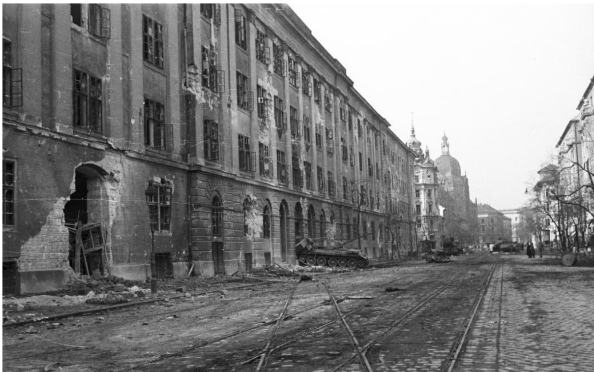
Üllői út a Ferenc körút felé nézve, balra a Kilián laktanya, előtte Maléter Pál T-34/85 harckocsija.