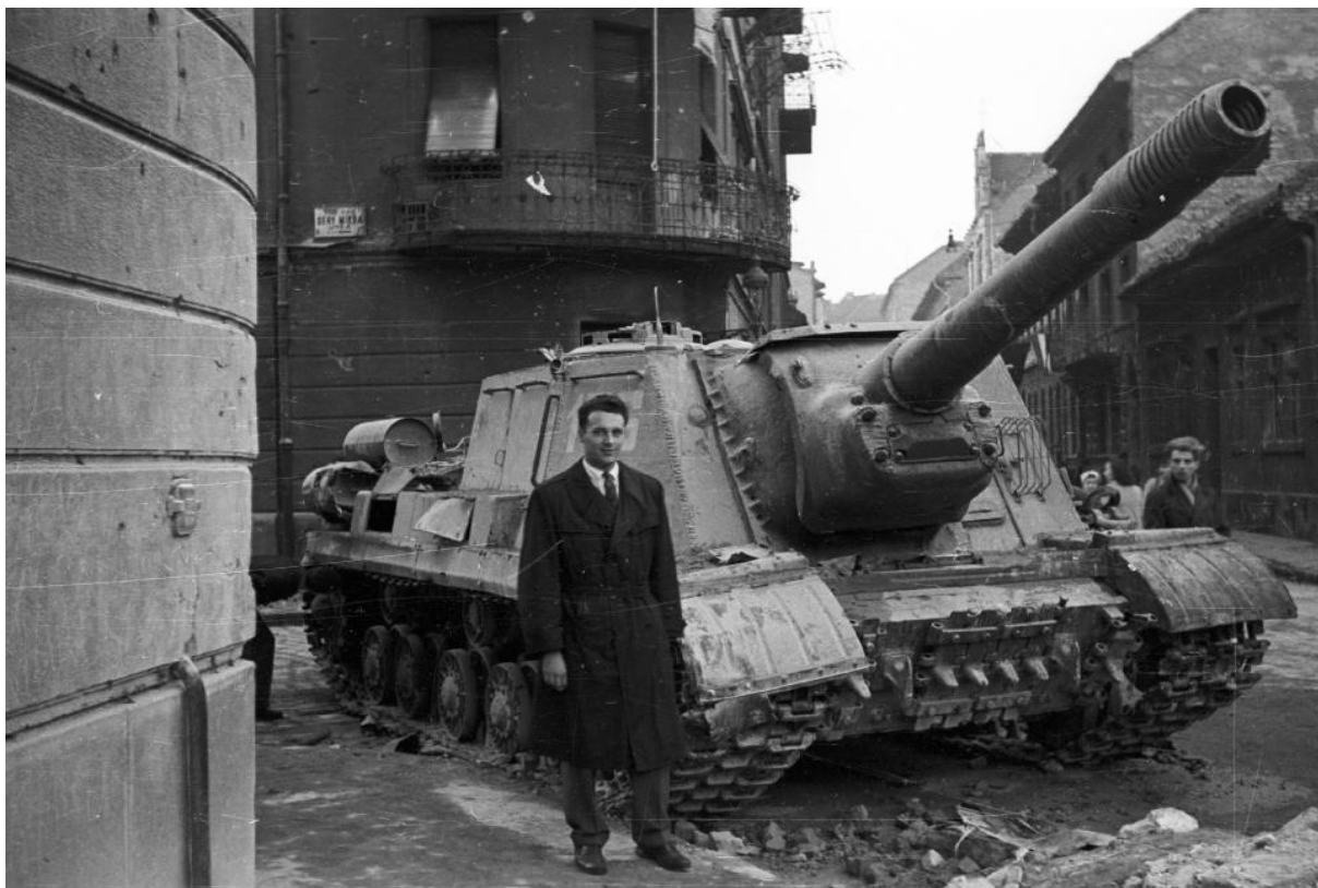
Fecske (Lévai Oszkár) utca a Déri Miksa utcai kereszteződésnél. Harcképtelenné tett ISU-152-es szovjet rohamlőveg.