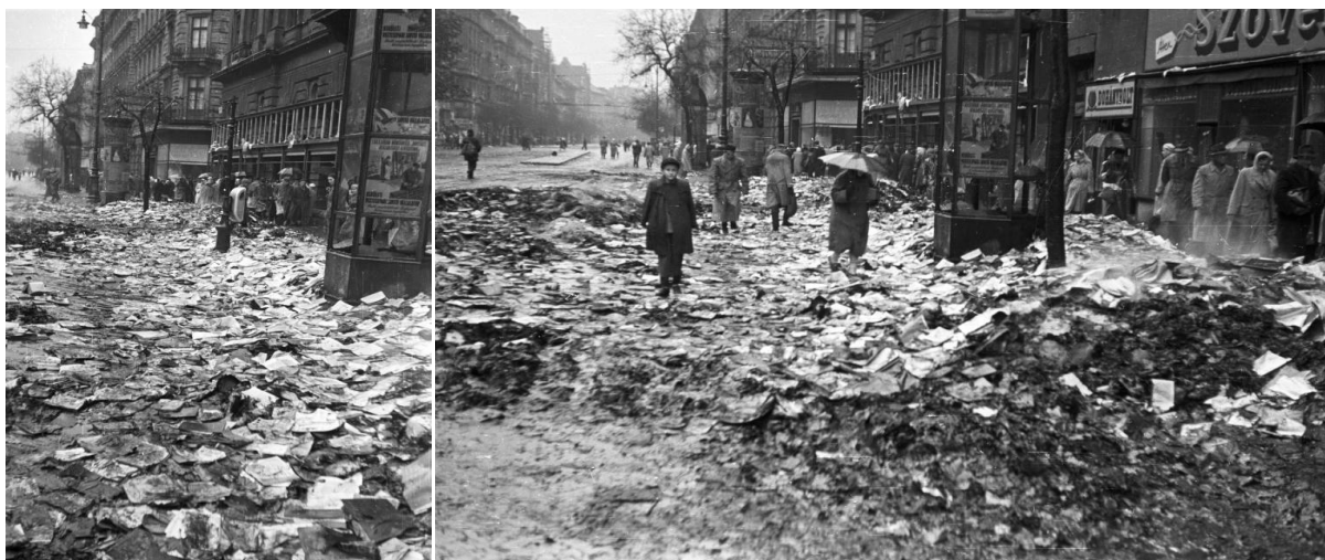
Az orosz könyvek maradványai elborítják az utcát. Teréz (Lenin) körút az Oktogon felől a Dohnányi Ernő (Szófia) utca felé nézve.