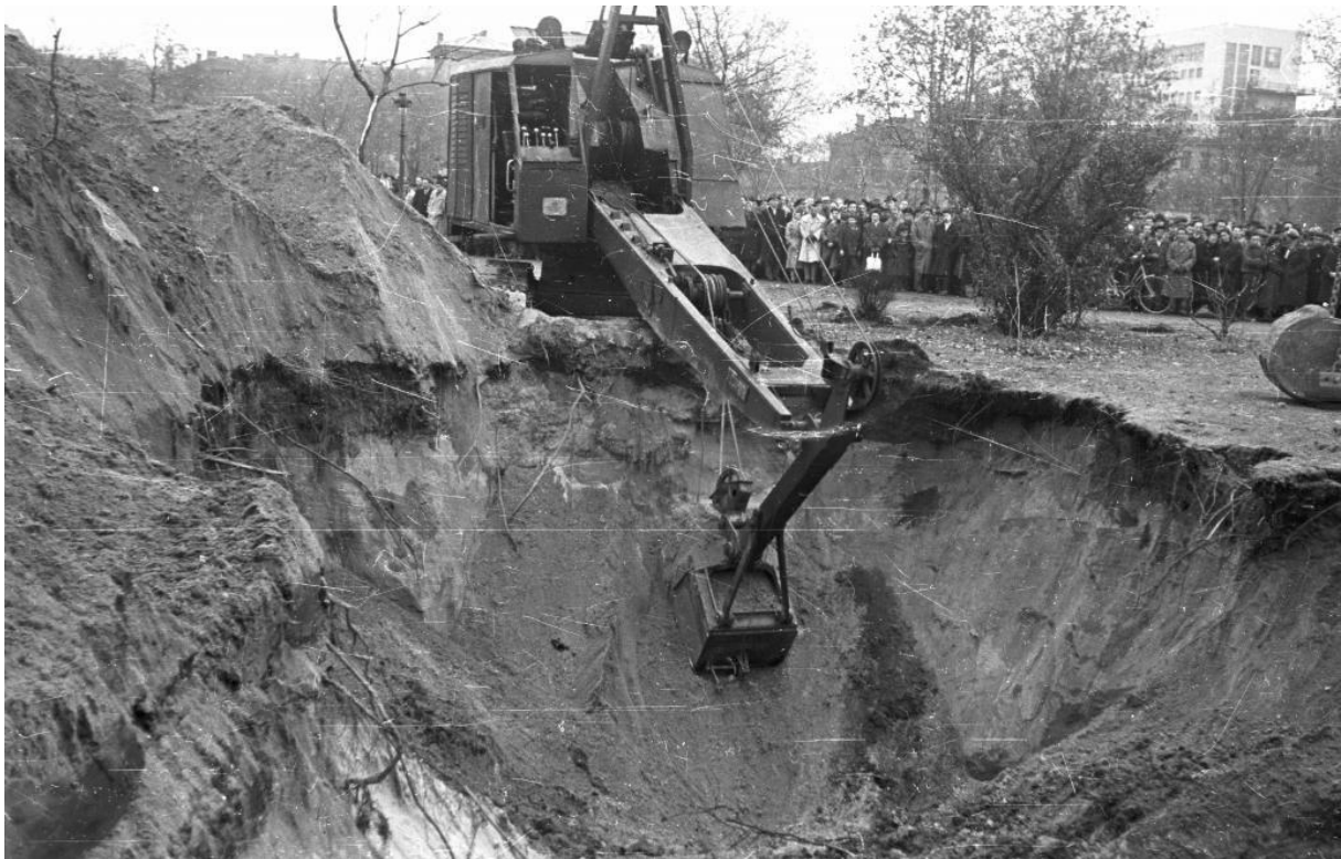
Kazamaták után kutatnak a Köztársaság téren

(Kiindulásnak: http://www.origo.hu/foto/multimedia/20141022-a-kazamatak-rejtelye.html )