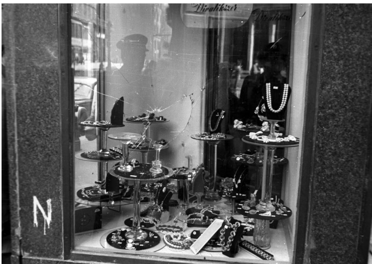
Ékszerüzlet Budapesten a forradalom napjaiban

©Jelen szakmai anyag az „1956 – a magyar forradalom a legújabb történelmi kutatások tükrében” című akkreditált pedagógus-továbbképzés (alapítási engedély száma: 27282/1/2016) keretében jött létre, amelyet a Prekog Alfa Szolgáltató és Tanácsadó Kft. a Közép- és Kelet-európai Történelem és Társadalom Kutatásáért Közalapítvány megbízásából szervezett. Az anyag minden üzleti célú felhasználása csak a nevezett szervezetek hozzájárulásával lehetséges.