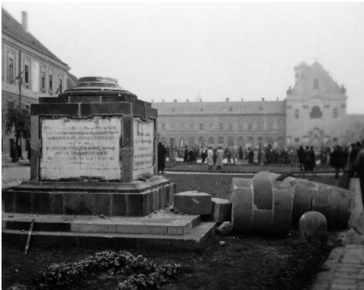
Vác – 1956-ban

Vizsgálják meg, volt-e változás a település köztereiben, jelképeiben 1956-ban!